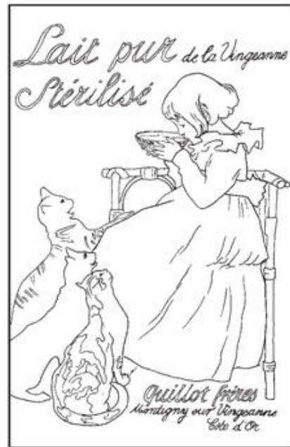
4. Théophile-Alexandre Steinlen, Lait pur Stérilisé