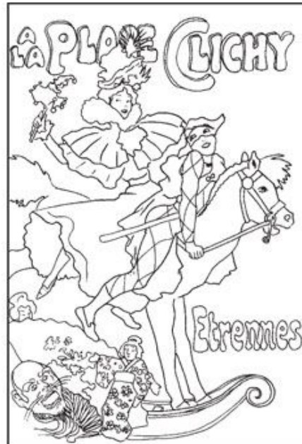
8. Georges Meunier, A la Place Clichy / Etreemes