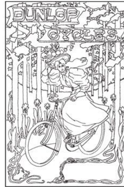
5. W.H.W., Dunlop Cycles