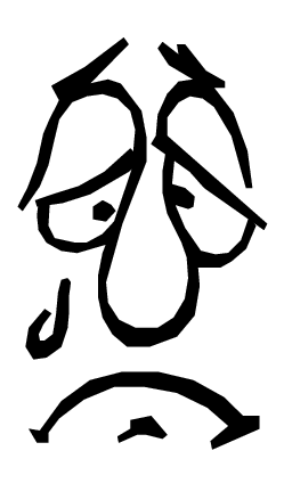
I'm sad. Estoy triste.