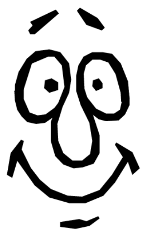
I'm happy. Estoy feliz.