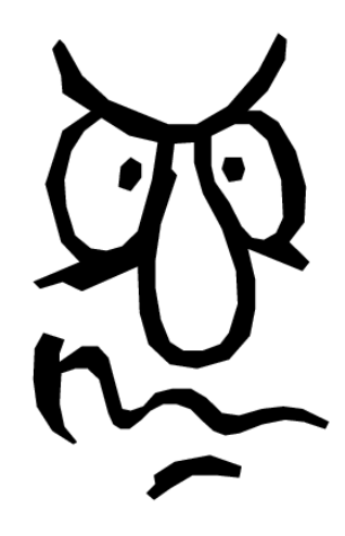
I'm angry. Estoy enojado.