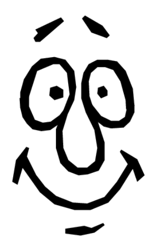
I'm happy. Estoy feliz.