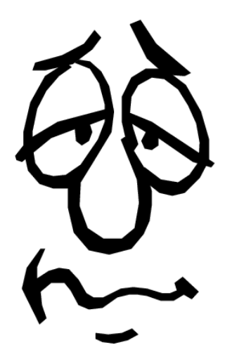
I'm tired. Estoy cansado.