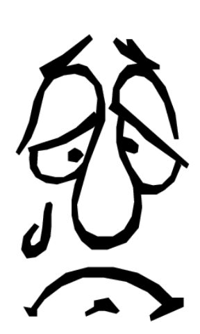
I'm sad. Estoy triste.